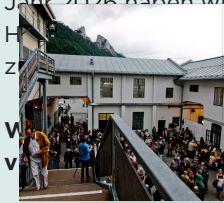
Festpielbühne Pernerinsel Ihren Besuch und

Ob Konzerte, Kabarets, der Wein- und BrauKunstMarkt, Straßentheater oder das beliebte Stadtfest: Auch für das Jahr 2026 haben wir in Zusammenarbeit mit der Stadt Hallein die Partnerveranstaltungen für Sie zusammengestellt. Unter Tieren überzeugen sich selbst!