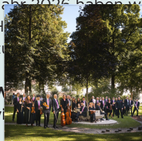
Festspielbühne Ihren Besuch und s!

Ob Konzerte, Kabarets, der Wein- und BrauKunstMarkt, Straßentheater oder das beliebte Stadtfest: Auch für das Jahr 2026 haben wir in Zusammenarbeit mit der Stadt Hallein eine Partnerveranstaltungen für Sie zusammengestellt. Sie überzeugen sich selbst!