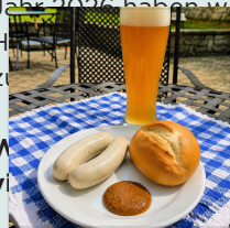
Weisswurst-Frühstück Galerie Schloss Wiespach Ihren Besuch und

Ob Konzerte, Kabarets, der Wein- und BrauKunstMarkt, Straßentheater oder das beliebte Stadtfest: Auch für das Jahr 2026 haben wir in Zusammenarbeit mit der Stadt Hallein eine Partnerveranstaltungen für Sie zusammengestellt. Sie überzeugen sich selbst!