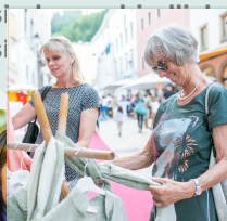
18. - 20. Mai 2026 | 09.00 Uhr Schnäppchen-markt

Die Termine sowie die Durchführung der Veranstaltungen sind ohne Gewähr. Terminverschiebungen und Absagen vorbehalten.