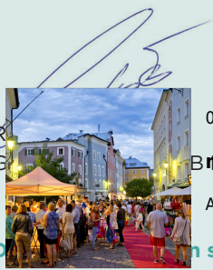
08. Mai 2026 | 18.00 Uhr