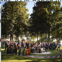
Festspielbühne Ihren Besuch und s!

Ob Konzerte, Kabarets, der Wein- und BrauKunstMarkt, Straßentheater oder das beliebte Stadtfest: Auch für das Jahr 2026 haben wir in Zusammenarbeit mit der Stadt Hallein eine Partnerveranstaltungen für Sie zusammengestellt. Sie überzeugen sich selbst!