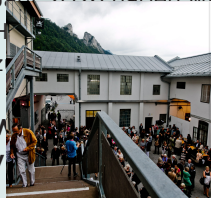
Festpielbühne Pernerinsel Ihren Besuch und

Ob Konzerte, Kabarets, der Wein- und BrauKunstMarkt, Straßentheater oder das beliebte Stadtfest: Auch für das Jahr 2026 haben wir in Zusammenarbeit mit der Stadt Hallein die Partnerveranstaltungen für Sie zusammengestellt. Unter Tieren überzeugen sich selbst!